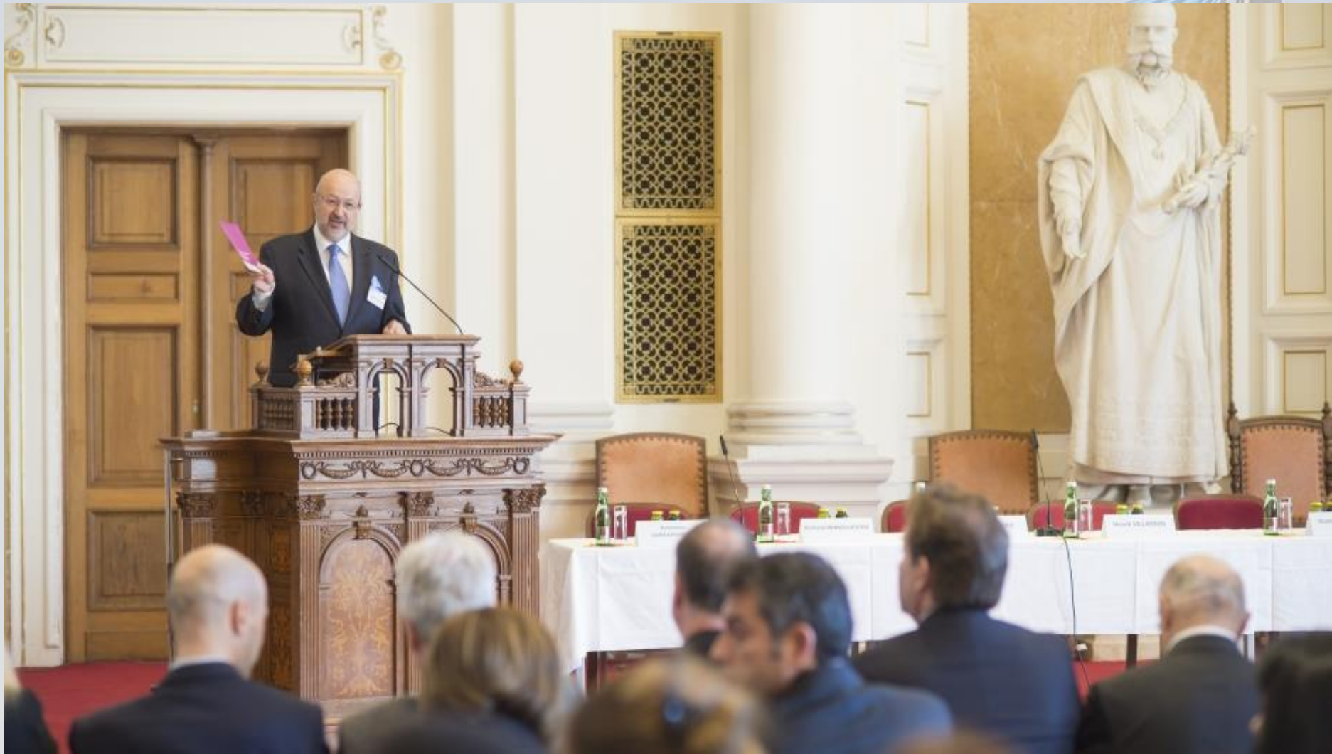
Зображення: OSCE High Commissioner on National Minorities Lamberto Zannier launches the Graz Recommendations on Access to Justice and National Minorities, Graz, Austria, 14 November 2017.

www.osce.org/hcnm/graz-recommendations (OSCE/Foto Fischer)